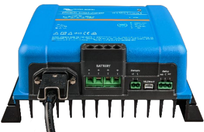
Phoenix Smart 12/50(3)