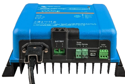
Phoenix Smart 12/50(1+1)